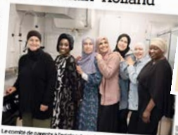
Le comité de parents à l'origine du projet de cuisine partagée.

À l'occasion du repas de quartier du 11 mai, le comité parents du centre social Espéranto aura organisé une cuisine dans les locaux de l'Espèce Romain-Rolland. Perchée dans le cadre de la troisième édition du budget participatif, cette initiative a permis de créer un lien entre les habitants et le centre social.