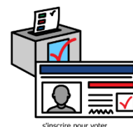
s'inscrire pour voter

Je ne suis pas inscrit sur la liste électorale, je demande à être inscrit.