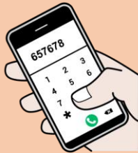
appeler au téléphone

Je téléphone à la Mairie pour connaître la date limite au 01 48 70 63 14