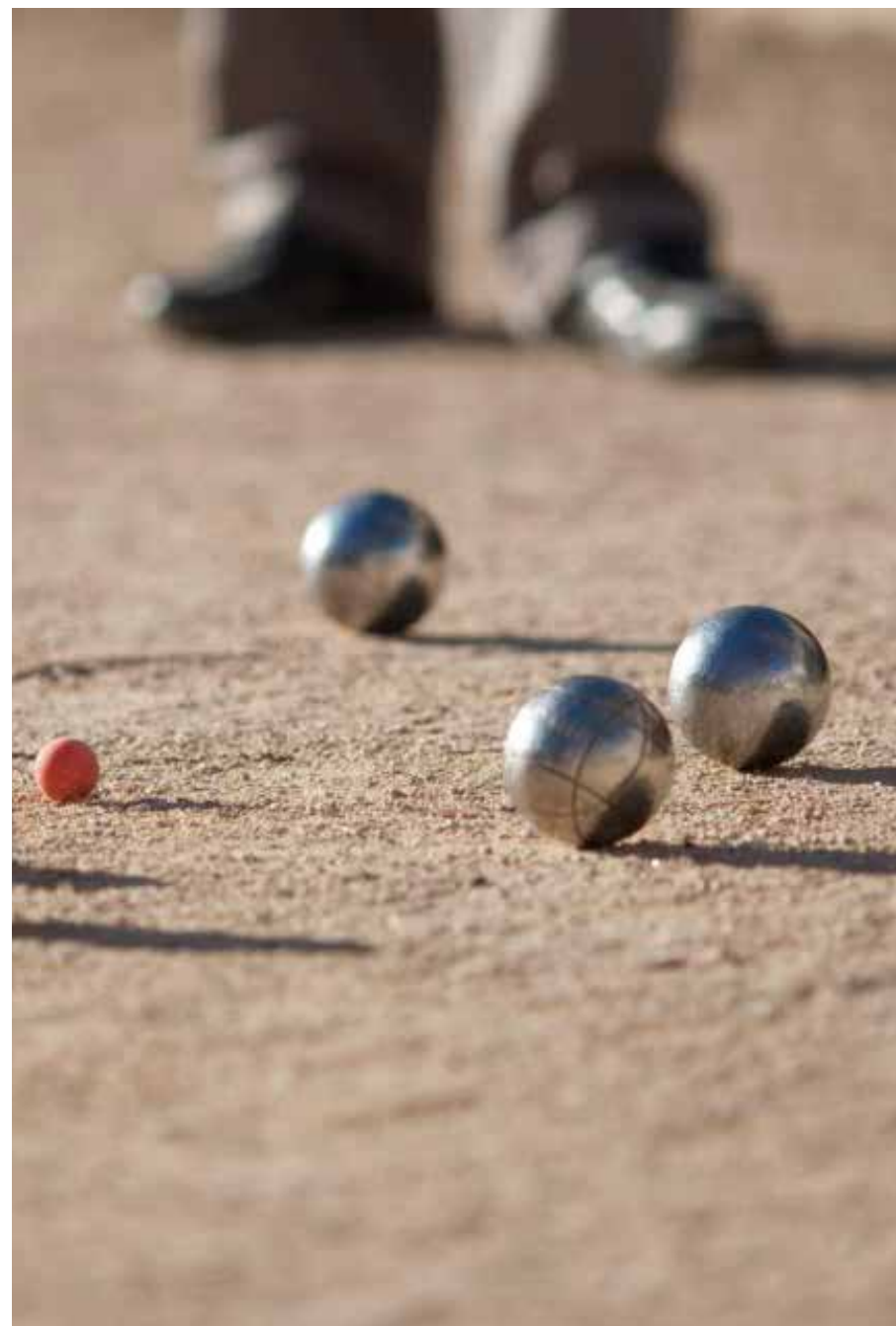
Centre sportif Arthur-Ashe et club de pétanque