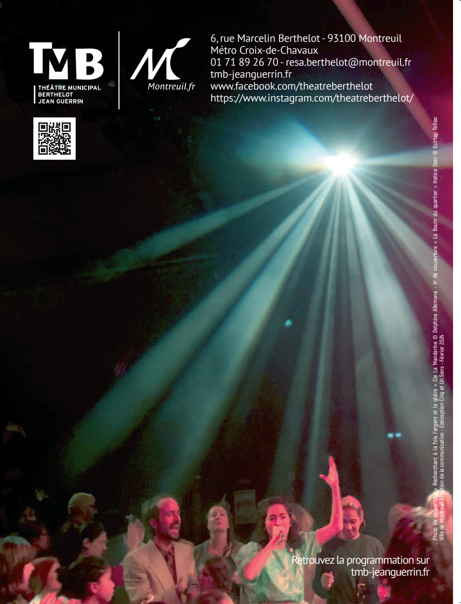
Photo de couverture : Rechercheur, à la fois l'égent et la gloire » Cie La Mandarine © Delphine Allemare - 4 e de couverture « La Boum du quartier » Halice Dzer © Eclairag-Fellic Ville de Montreuil Direction de la communication - Conception Cinq et Un Sens - Février 2024

Retrouvez la programmation sur tmb-jeanguerrin.fr