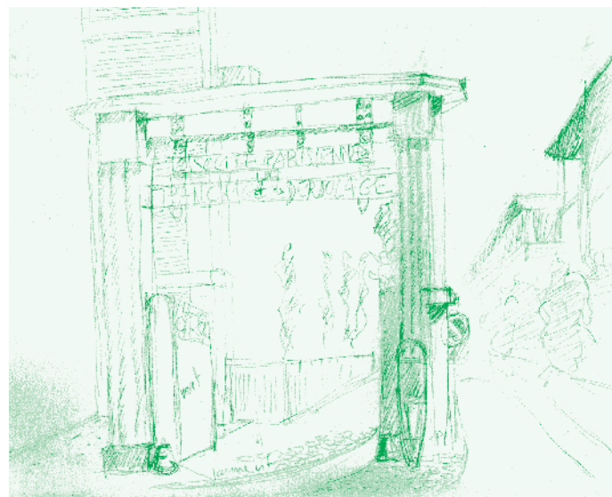
Portail de l'ancienne Société de Tranchage et de Déroulage (SPTD)

Engagez-vous dans la rue de Paris pour rejoindre la station de métro Robespierre, où vous retrouvez le point de départ.