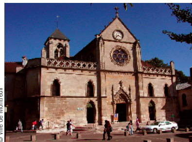
Eglise Saint Pierre-Saint Paul

C Vous apercevez tout de suite sur votre droite le jardin de l'église, qui accueillait autrefois le cimetière de la ville.