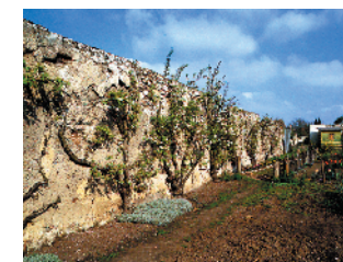
Les murs à pêches

8 Les murs à pêches (l'entrée est située au fond de l'impasse Gobétue)