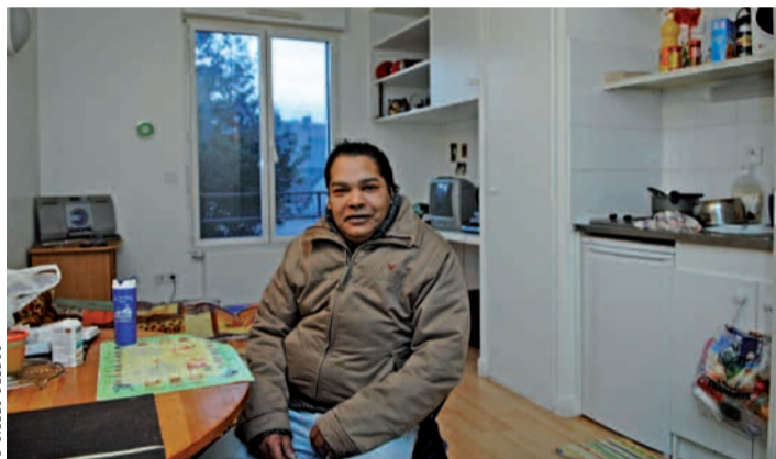
Il y a quelques mois encore, « Monsieur Louis » vivait à l'hôtel. Au sein de la maison-relais, il apprend à « vivre normalement ».

Parce que le logement est la clef de l'insertion sociale et professionnelle, l'association Emmaüs Paris offre aux personnes sans domicile des solutions d'hébergement adaptées à leur situation. De l'accueil de jour aux centres d'hébergement et de réinsertion sociale, en passant par l'hébergement d'urgence et les hôtels sociaux, l'aide au logement forme, au sein du mouvement Emmaüs, une véritable chaîne dont le dernier maillon est la maison-relais. « Une maison-relais accueille, pour une durée illimitée, des personnes qui ne peuvent pas accéder au parc locatif social ou