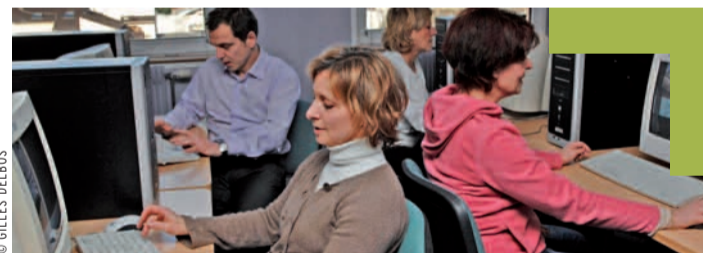
Installé dans un premier temps à Romainville, Horizon 93 accueille désormais ses bénéficiaires au 14, rue de la Beaune, en plein centre-ville. Ce déménagement a permis d'adapter les nouveaux locaux de la plate-forme multiservice à son activité.

Cette réussite n'a rien d'un miracle. « Lorsque l'on s'en donne les moyens, on parvient à insérer durablement, insiste le directeur. Horizon 93 a été créé sur la base du constat que l'émiettement de l'offre des services d'insertion nuisait à leur efficacité. En 2002, l'ANPE et l'AFPA ont donc décidé de mutualiser leurs compétences pour créer une plate-forme qui regroupe plusieurs services. Il