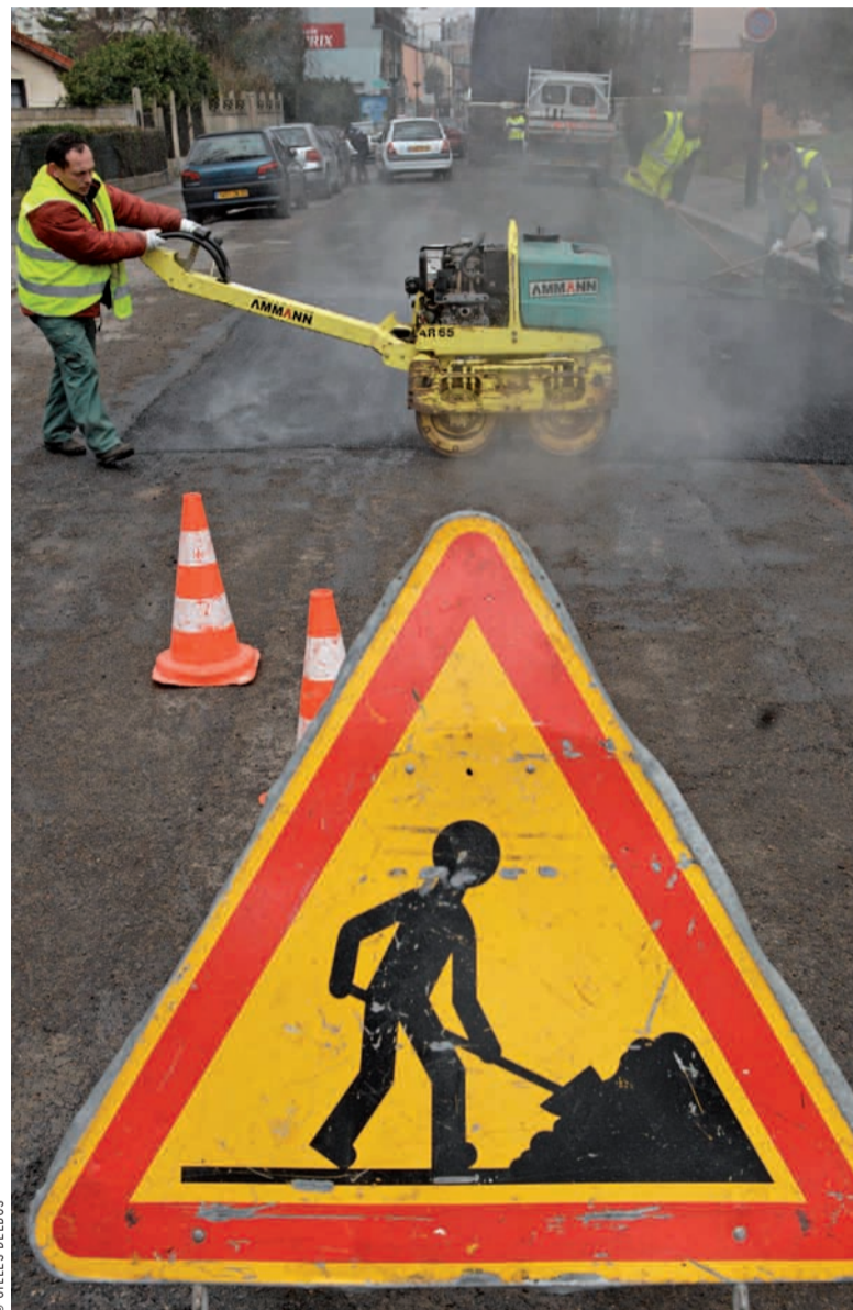
Les paveurs interviendront dans une vingtaine de rues jusqu'à la mi-février.

Le gel a endommagé certaines rues de la ville. Depuis lundi 19 janvier, les équipes de paveurs s'affairent à réparer les chaussées les plus touchées. Priorité est donnée aux voies de bus. Objectif : travailler au plus vite afin d'éviter la formation de poinçonnements, puis de nids-de-poule.