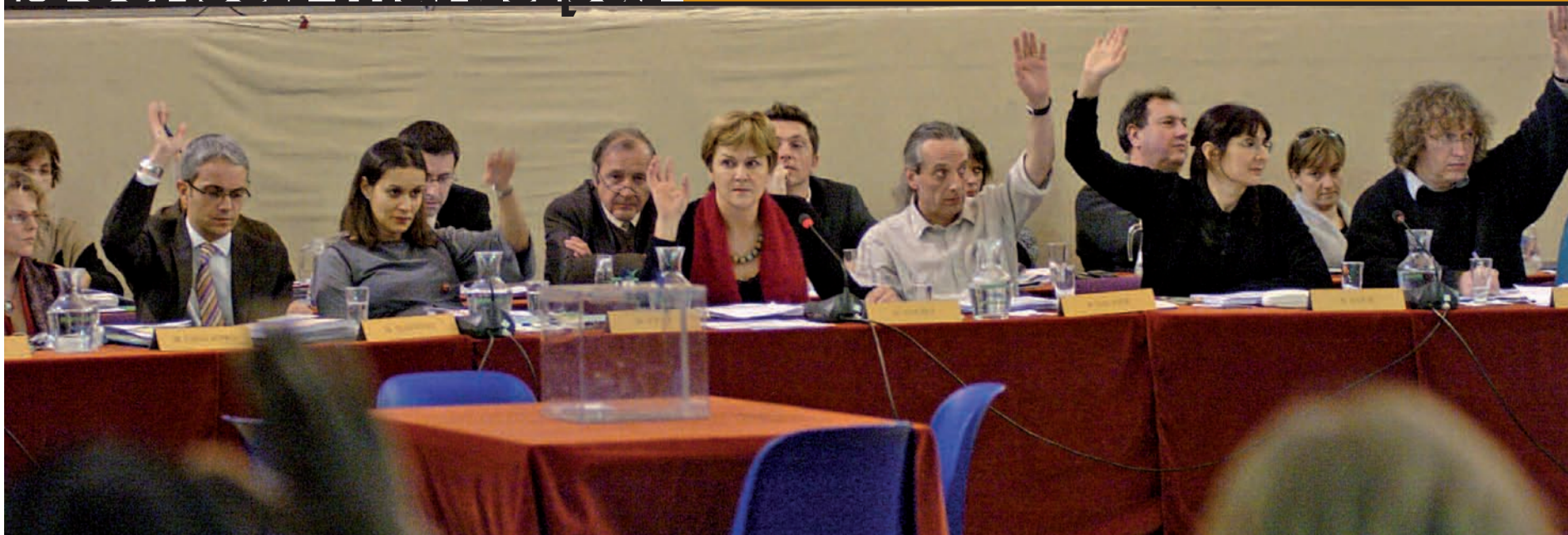
La proposition d'attribuer une subvention exceptionnelle à Médecins du Monde est adoptée à l'unanimité.