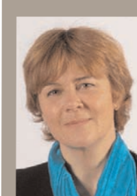
Dominique Voynet Maire de Montreuil Sénatrice de Seine-Saint-Denis

La neige est tombée en abondance, provoquant une belle pagaille sur les routes au lever du jour. Au fil des heures, le temps s'est radouci, il pleut désormais. Depuis ce matin, on nous alerte... Sous ce porche un homme frigorifié. Dans cette maison en ruines, sans eau et sans chauffage, une famille rom avec des enfants... Faites quelque chose ! On ne peut pas les laisser là ! Impossible, bien sûr, dans l'urgence, de rester sourd à cette détresse.