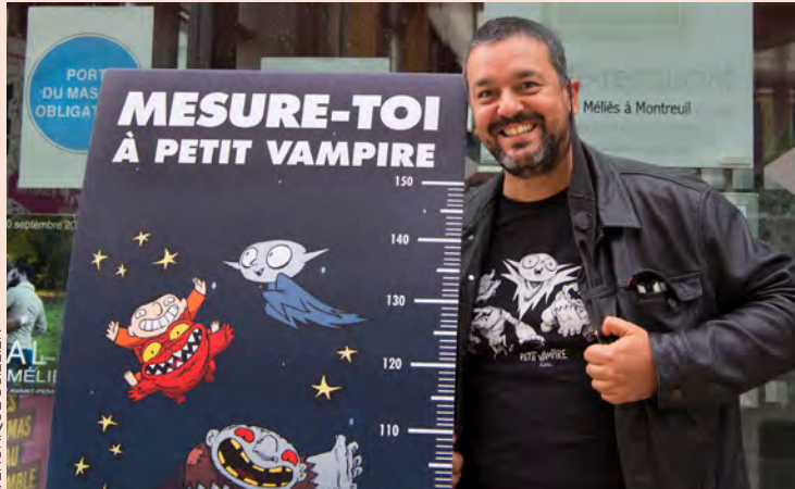
Joann Sfar, auteur à grand succès de bande dessinée et réalisateur du dessin animé Petit vampire , à l'affiche le 15 septembre.