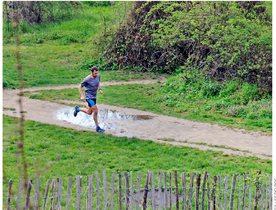
Enfants et adultes peuvent enfin retrouver les pistes d'athlétisme et les cours de tennis en plein air. On peut aussi profiter à fond des parcs de Montreuil (ici, celui des Beaumonts).

Avec l'allègement du confinement, les sports individuels en plein air ont repris le 28 novembre. C'est notamment le cas du tennis au centre sportif Arthur-Ashe et de l'athlétisme au Club athlétique de Montreuil.