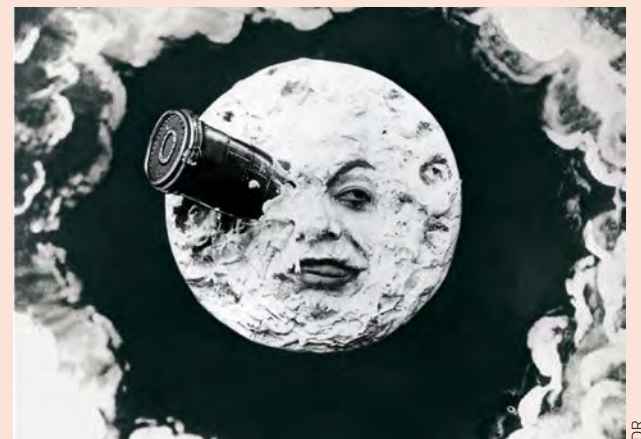
Ⓣ Balade virtuelle ou pédestre avec Georges Méliès.

Venez découvrir ou approfondir vos connaissances horticoles lors d'une visite