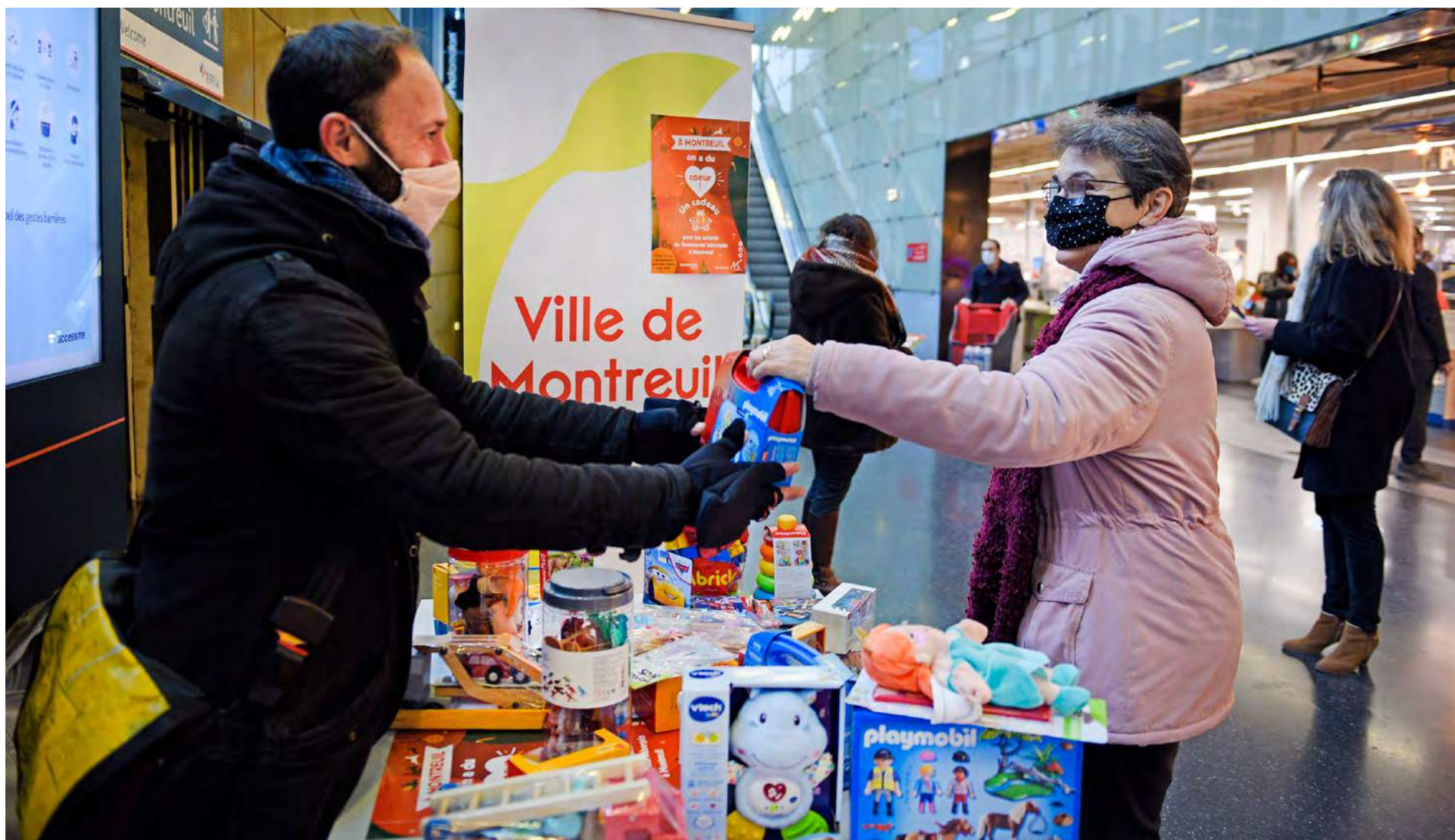
Un agent de la Ville reçoit les dons de jouets sur un spot dédié mis en place dans l'enceinte de l'ensemble Carrefour, porte de Montreuil.

Dossier réalisé par C. Chalier et J. Testa