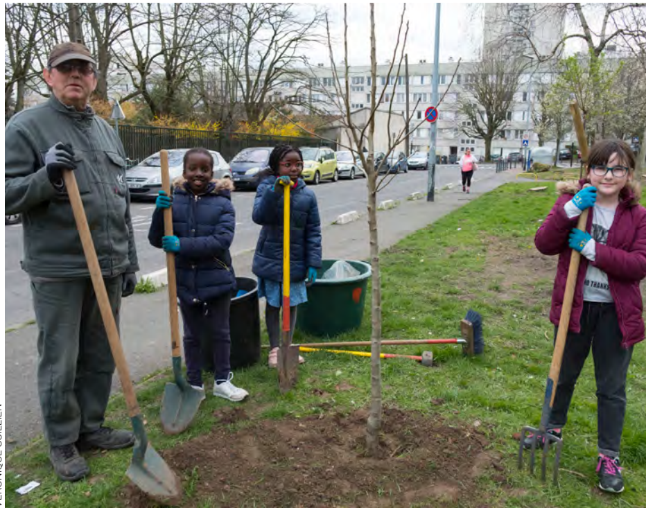
À La Noue, en 2019, plantation d'arbres fruitiers avec l'aide des enfants.

Depuis 2018, des espaces verts de la ville sont traités en gestion différenciée, c'est-à-dire plantés et soignés différemment selon leurs usages, de manière à favoriser la biodiversité, tout en permettant aux habitants d'en profiter. D'année en année, cette gestion monte en puissance avec de nouveaux lieux d'expérimentations et une nouvelle thématique. Des protocoles participatifs (avec comptage des espèces de papillons et de plantes sauvages) permettent d'évaluer scientifiquement l'état de la biodiversité dans des lieux précis. En 2020, la thématique était la faune. Ainsi, les 70 arbres et 300 arbustes (60 d'entre eux étant comestibles) dont la plantation s'échelonne cet hiver fournissent une aide d'une façon ou d'une autre : cachettes pour les hérissons ; abris et pollen pour les insectes ; nourriture pour les oiseaux. À certaines périodes, les