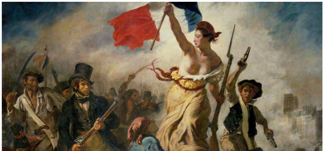
La Liberté guidant le peuple, une huile sur toile peinte par Eugène Delacroix en 1830.

LA SECONDE QUESTION A TRAIT À L'ALIMENTATION. La foudre du Covid-19 a dévoilé l'existence d'une autre épidémie, celle de la précarité. Qu'elle soit relative ou pérenne, cette précarité touche de trop nombreux Montreuillois. Avant la crise sanitaire, les choses allaient cahin-caha pour beaucoup. Les fins de mois pouvaient être tendues, mais l'arrivée de la paye