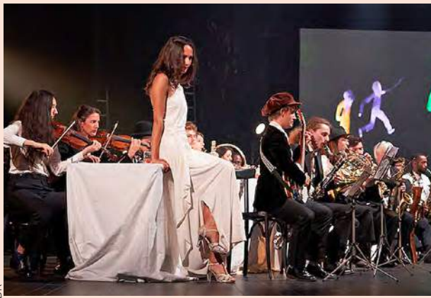
Ⓣ L'Œil et l'Oreille, Federico Fellini rencontre Nino Rota.