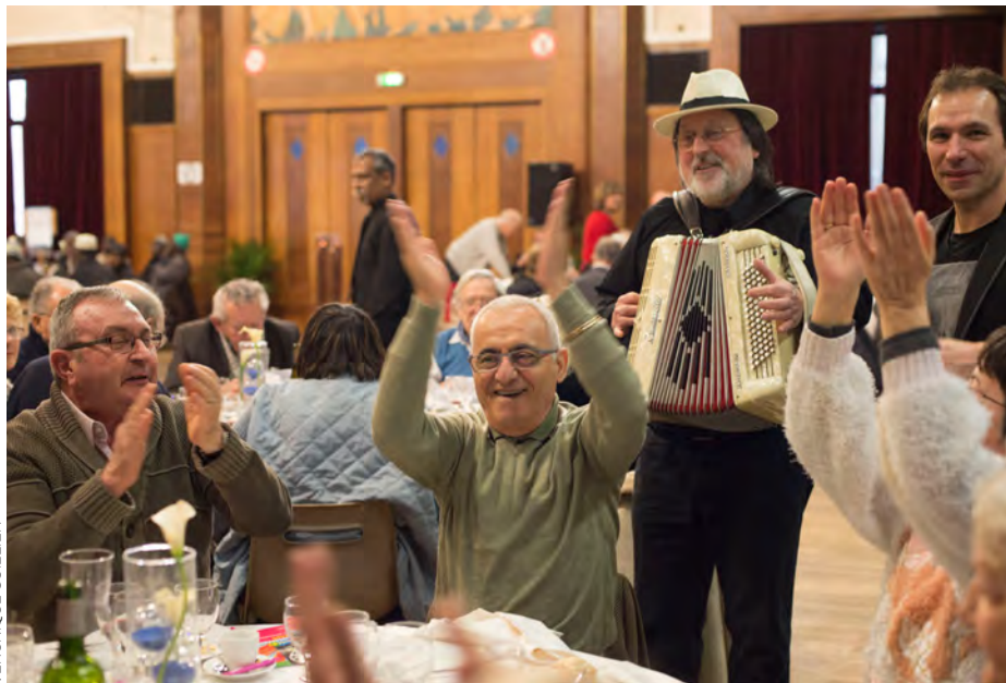
Pour protéger nos anciens, les rituels banquets du Nouvel An sont annulés.

Dans le cadre de cette opération de solidarité, jusqu'au samedi 12 décembre, chacun pourra déposer des jouets neufs aux points de collecte, tenus par des habitants volontaires et des agents municipaux. On les trouve : au Carrefour de la porte de Montreuil, 235, rue Étienne-Marcel ; au Carrefour Market Cœur-