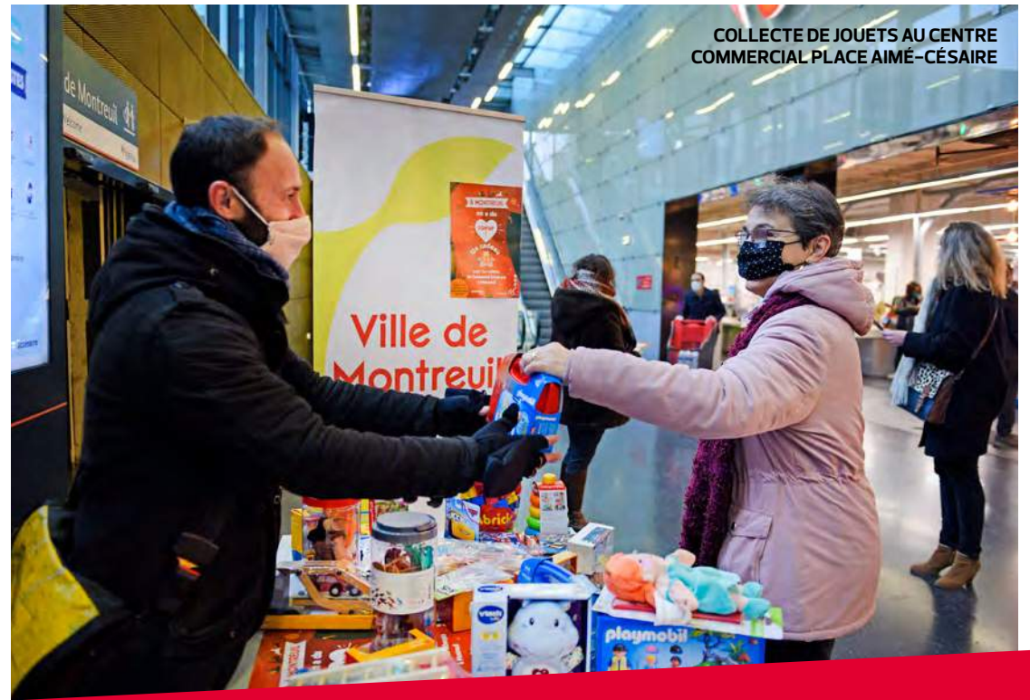
COLLECTE DE JOUETS AU CENTRE COMMERCIAL PLACE AIMÉ-CÉSAIRE

Les Montreuillois se préparent à vivre des fêtes de fin d'année historiques, où la solidarité et le partage se réinventent. Le point sur les actions de la municipalité et des associations. ■ P. 6 ET 7