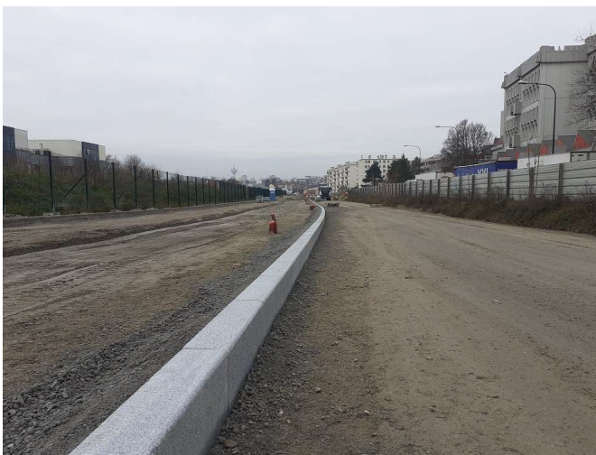
Installation de bordures rue Didier Daurat, à Montreuil

La ligne de tramway T1 relie actuellement Asnières – Gennevilliers – Les Courtilles à Noisy-le-Sec. Son prolongement à l'est, de Noisy-le-Sec à Val de Fontenay, améliorera les conditions de transport de l'est de la région tout en se connectant au réseau de transports existant et à venir, notamment dans le cadre du Nouveau Grand Paris, et permettra de desservir les villes de Noisy-le-Sec, Romainville, Montreuil, Rosny-sous-Bois et Fontenay-sous-Bois (RER A et E).