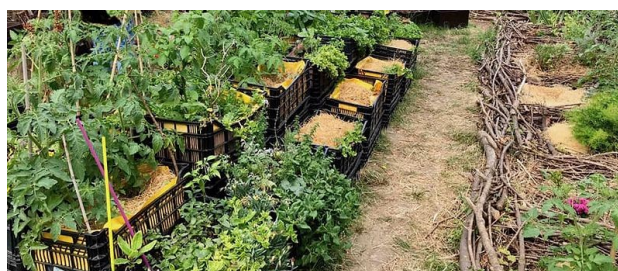
jardin Autour du pommier.

Nous démarrons ce printemps une série de visites de jardins partagés montreuillois. Voici ceux de Root Cause , une association créée par Rosie Harding, avec des rencontres