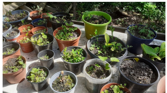
Vente de plante au Jardin de la Lune, avril 2021

A l'arrivée des beaux jours, la demande de plantes explose mais on ne sait pas toujours où s'en procurer, notamment dans une ville où il n'y a pas de jardinerie ! Voici un aide-mémoire qui sera sans doute utile aux jardiniers :