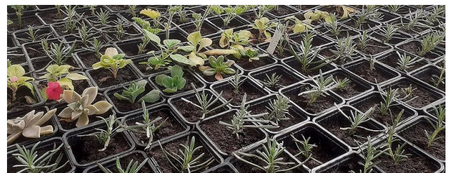
Image prise dans la serre de multiplication le 23.03.21 : les semis réalisés dans le cadre des ateliers pédagogiques avec les classes se développent tranquillement, arrosés régulièrement par l'équipe du centre horticole. Les plants seront redonnés aux enfants dans quelques semaines à la période de plantation.

Voir la page éducation à la nature à Montreuil