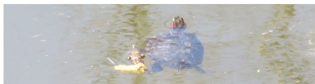
mars 2021