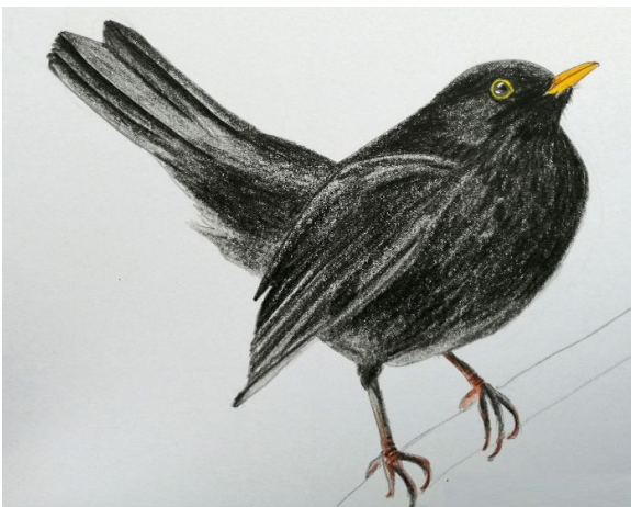
Le chant mélodieux du merle commence le plus tôt et finit le plus tard Dessin : Lise Laclavetine

Le printemps est là : les feuilles des arbres ne sont pas encore toutes sorties de leurs bourgeons mais la présence des oiseaux