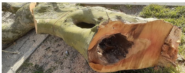
Bd de la Boissière, mars 2021

En raison d'un champignon provoquant des chutes de branches certains arbres de voies départementales doivent être prochainement abattus : c'est le cas à Montreuil de 24 platanes sur le boulevard de la Boissière (21 côté Rosny et 3 côté Montreuil). Pour tout complément d'information, s'adresser à arbres@seinesaintdenis.fr