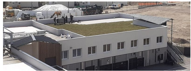
Installation d'une terrasse végétalisée sur l'école Odru, avril 2021

Les toitures végétalisées recouvrent différentes réalités à Montreuil : la majorité des "toits verts" sont recouverts d'une couche de sedum, des plantes qui résistent assez bien aux conditions climatiques et ne demandent pas d'entretien (voir photo). Leur intérêt pour la biodiversité est peu notable et la faible hauteur de terre ne permet pas d'améliorer l'isolation du bâtiment ni de capter le carbone. D'autres toits comme le bâtiment face à la mare du château d'eau du Bel-Air ou la terrasse de Mozinor ont 80 cm de terre : ils sont plus performants en terme d'accueil de la biodiversité et d'isolation thermique, mais les conditions d'accès ne permettent pas toujours des usages récréatifs (jardinage, s'asseoir, lire...) et leur structure nécessite une conception particulière avec un surcroît de matériaux (exception : la dalle Hannah Arendt et son jardin de l'association des femmes maliennes). Le PLUi de 2020 prévoit à Montreuil un minimum de 30 cm de terre pour les toitures de plus de 100 m 2 , un compromis qui permet l'implantation des plantes, une bonne isolation, la rétention d'eau, une halte pour la biodiversité et quand c'est possible une utilisation par les habitants. Un décompte des surfaces de toits végétalisés est en cours à Montreuil mais les fonctionnalités réelles ne peuvent se réduire aux surfaces.