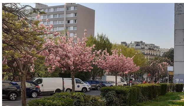
L'avenue de la Résistance revêt sa robe printanière ! - Photo avril 2021

Les associations de l'impasse Gobétue ouvrent leur parcelle dans les murs à pêches chaque dimanche de 14 h 30 à 16 h 30 La parcelle publique du Jardin du Partage au 77 rue Pierre de Montreuil est ouverte les mercredis et les WE La Maison des Murs à Pêches au 89 rue Pierre de Montreuil est fermée pendant cette période.