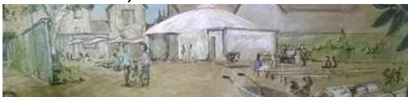
Dessin du projet Le Fait Tout / Récolte Urbaine

Pour gérer un "terrain en attente d'aménagement", le temps est maintenant loin où l'on se contentait de mettre une palissade fermée pendant des années. Aujourd'hui les friches sont valorisées comme support de biodiversité et/ou d'animations. Suite à un appel à projet, le Territoire Est Ensemble a confié à des associations l'animation de trois friches à Montreuil et Bobigny afin d'en faire des lieux d'expérimentations urbaines. À Montreuil, deux sites sont en cours d'installation :