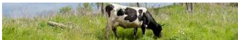
Une des 2 vaches pie noir au parc des Beaumonts